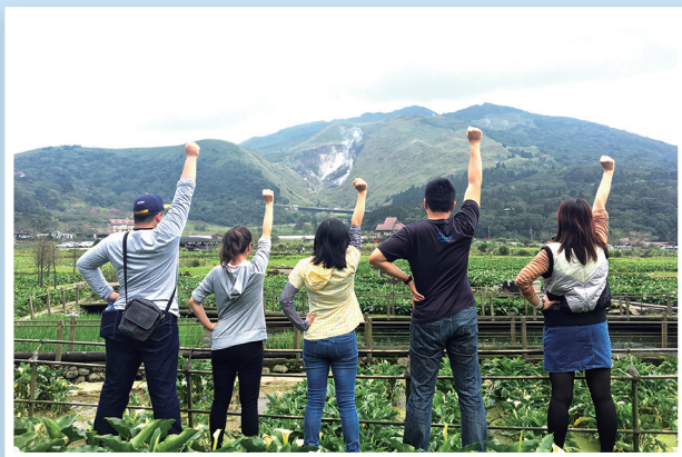
▲在海芋田裡的戶外活動，我們齊聲讚美造物主的奇工妙化。 ◀在主內親如一家，我們更有心靈的歸屬。