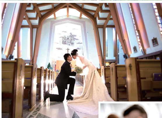
▲在教堂舉行婚姻聖事，有神聖性、單一性及永久性。 ▶聖言居住在我們中間